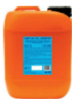
Продукт Cillit-CC 45+BIOSTOP Упаковка от 10 до 20 кг

Предписание DMiSe от 26/06/15 для соблюдения требований к сохранению энергии в зданиях.